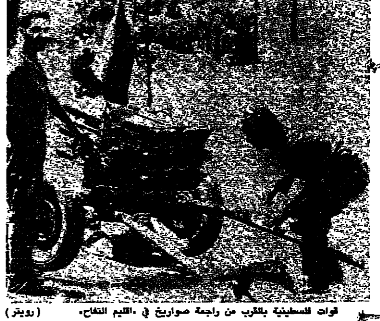
قوات فلسطينية بالقرب من راجمة صواريخ في اقليم الفلج

ابغ الرئيس السوري حافظ الاسد مبعوثاً كويتياً أمس حرص سوريا على عدم التصعيد وعلى حل الخلافات العربية عن طريق الحوار. وكان الرئيس الاسد قد استقبل امس الدكتور عبد الرحمن العوضي وزير الدولة الكويتي لشؤون مجلس الوزراء، الذي سلمه رسالة خطية من الشيخ جابر الاحمد الصباح امير دولة الكويت، تتعلق بخلاف بين العراق والكويت. وقالت الوكالة العربية السورية للانباء، ان الرئيس الاسد أكد للمبعوث الكويتي ان حل الخلافات العربية بالحوار من شأنه ان يحقق حلاً ناجحاً ويساعد على تحقيق التضامن العربي والعمل العربي المشترك، الذي تحتاجه الامة العربية، والذي يعتبر ضرورة ملحة.